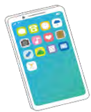
初期設定資料閲覧用の PCやスマートフォン