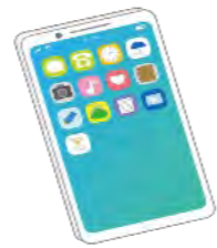
初期設定資料閲覧用の PCやスマートフォン