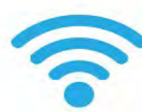
インターネット環境