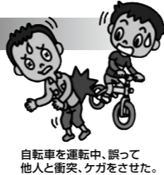
自転車を運転中、誤って 他人と衝突、ケガをさせた。

※個人賠償責任については日本国内での事故(訴訟が日本国外の裁判所に提起された場合等を除きます。)に 限り、示談交渉は原則として東京海上日動が行います。