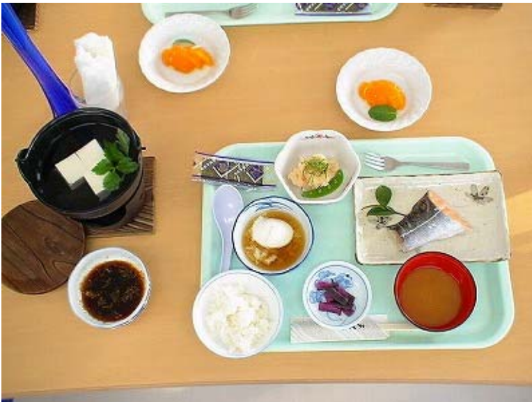
朝食例 2 (和食)