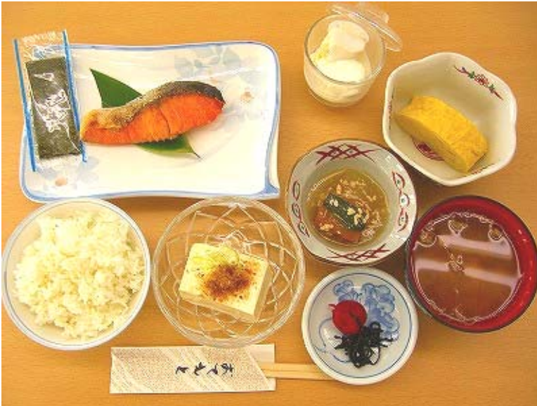
朝食例 1 (和食)